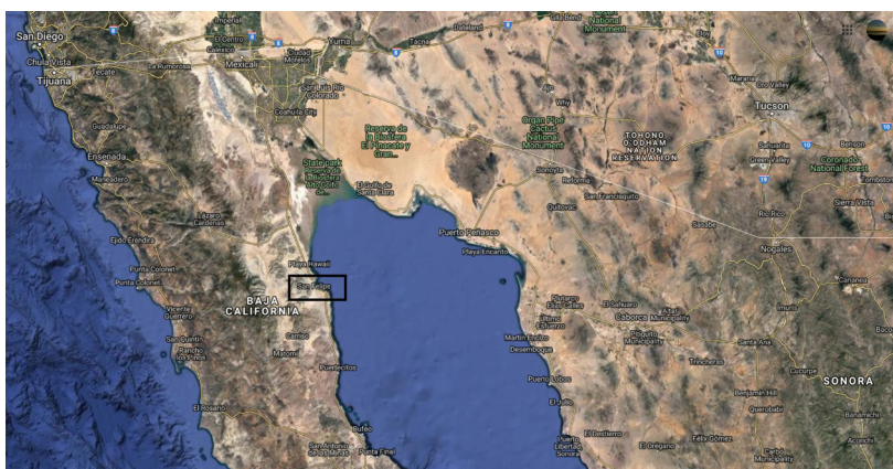
Figura 1 Ubicación de San Felipe, Baja California, México